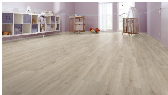
Chêne Marrakech 6396